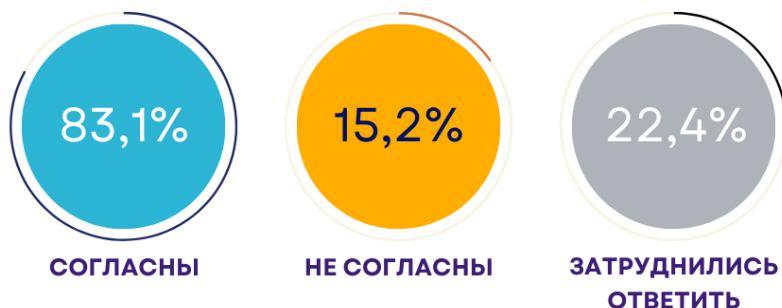
Рисунок 1 – «Согласны ли Вы с тем, что в национальном государстве коренная нация должна численно превосходить все другие живущие в этой стране нации?»

Коренной этнос, коренная нация. Проблематика коренного этноса, коренной нации для казахстанского общества и, в особенности, для казахов является весьма чувствительной. Так, респондентам задавался вопрос «Согласны ли Вы с тем, что в национальном государстве коренная нация должна численно превосходить все другие живущие в этой стране нации?». Большинство опрошенных респондентов в той или иной степени согласны с утверждением «в национальном государстве коренная нация должна численно превосходить все другие живущие в этой стране нации». 63,3% опрошенных полностью согласны с этим утверждением, 19,8% - частично согласны. Доля несогласных составляет 15,2%.