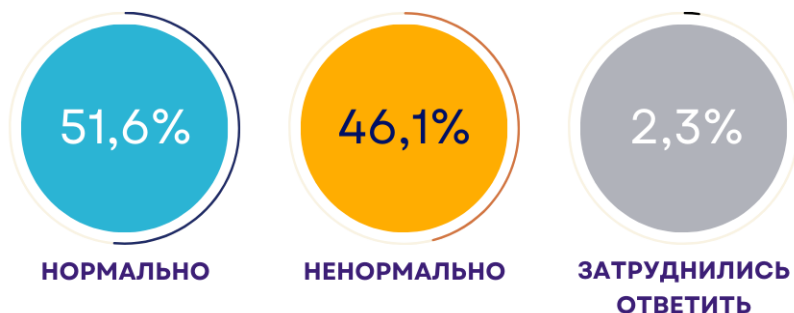
Рисунок 2 – «Если коренная нация не составляет численное большинство в своем государстве, Вы считаете это нормально или нет?»

Как оказал опрос, мнения людей разделились. Доминирует мнение о «нормальности» такого положения, но немногим меньше тех, кто имеет прямо противоположную позицию. Рассматривая результаты ответов в этническом срезе, следует отметить, что среди русских больше согласных с приведенным утверждением, а именно 62,7% (31,6% - «нормально», 31,1% - «отчасти нормально»); при этом несогласных в данной этнической группе 34,9% (15,8% - «отчасти ненормально», 19,1% - «совершенно ненормально»).