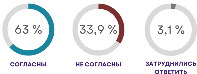
Рисунок 3 – «Согласны ли Вы с тем, что русских, как и казахов, можно считать национальным большинством в Казахстане?»

Можно ли русских, как и казахов считать национальным большинством в Казахстане? Согласных с этим утверждением, по данным опроса – 63,0% (34,6% – согласны, 28,4% – отчасти согласны), не согласных – 33,9%.