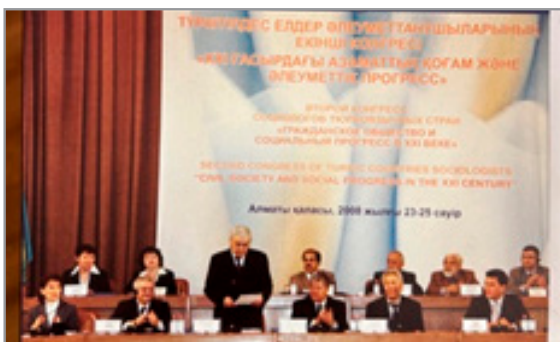
Түркітілдес елдер әлеуметтанушыларының II Конгресі (Алматы, 2008 ж.).