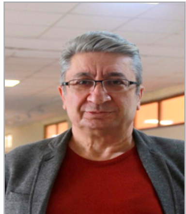
Жас оқытушы және Ыстамбұл университетінің профессоры Хаяти Түфекчиогл