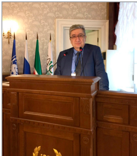
Түркітілдес елдер әлеуметтанушыларының VII Конгресі (Қазан, 2020 ж.).