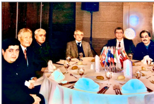
Түркітілдес елдер әлеуметтанушыларының II Конгресі (Алматы, 2008 ж.).