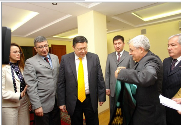
Ыстамбұл университетінің профессоры Корқут Туна мен Ыстамбұл университетінің құрметті профессоры М.М. Тәжиннің кездесуі (Алматы, 2008 ж.).