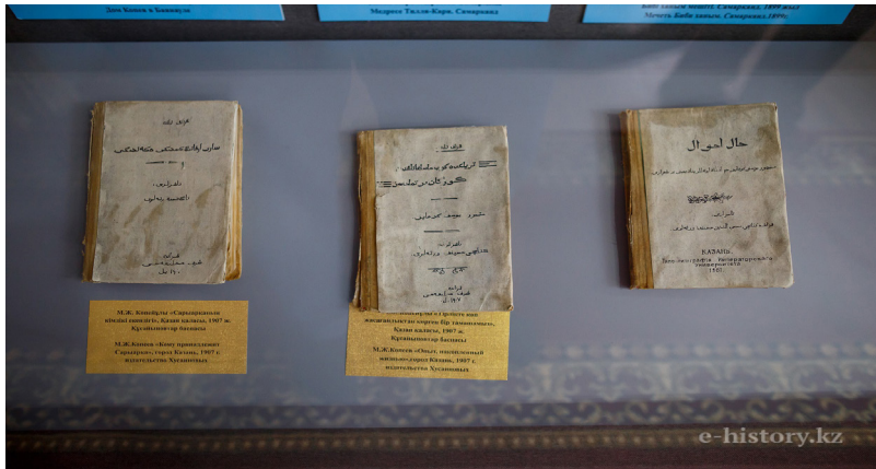
1-сурет. Ғұлама жазбалары

Осылайша, Мәшһүр Жүсіп Көпейұлының шығармаларында тарауық намазының рухани, әлеуметтік және денсаулық тұрғысынан маңыздылығы кеңінен қамтылған. Ғұлама бұл намазды тек қосымша құлшылық емес, адамның рухани жетілуі, Аллаға жақындауы және мұсылман қауымының бірлігін нығайтудың тиімді құралы ретінде сипаттайды.